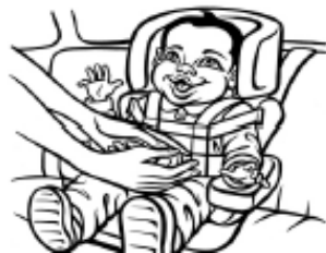
Límites personales: asiento para el auto/correas //cinturón de seguridad