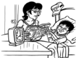
Límite personal: reglas sobre la hora de acostarse