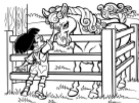
Límites personales: cercas