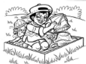
Límites personales: paredes de una caja de arena