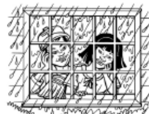
Límite personal: jugar afuera