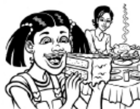
Límite personal: reglas sobre la cena y los postres